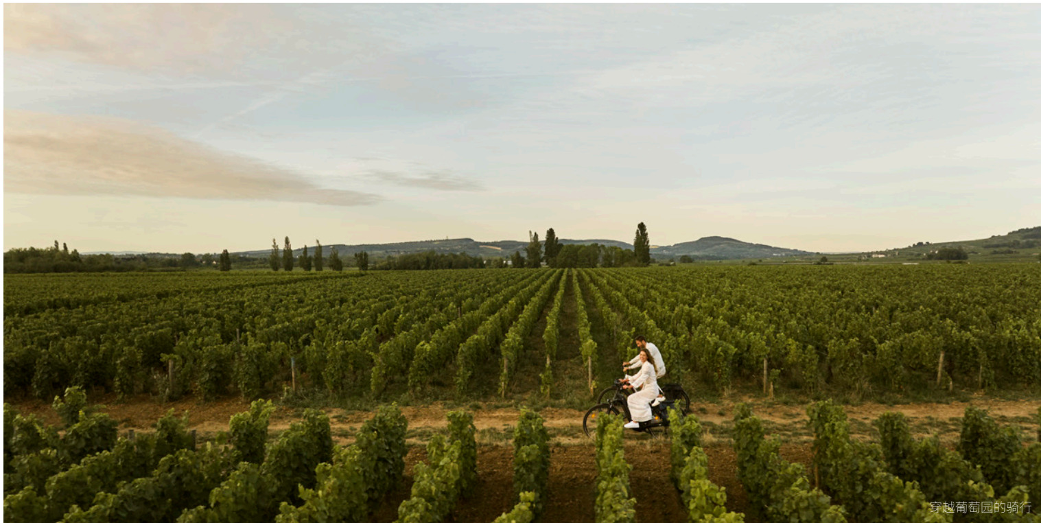
穿越葡萄园的骑行